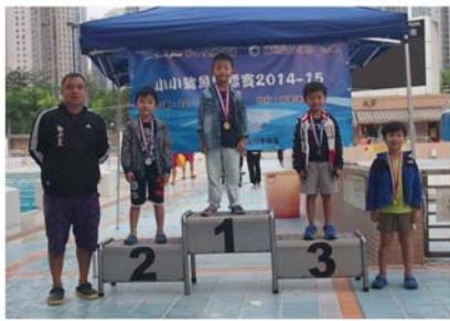
會內比賽, 建立信心