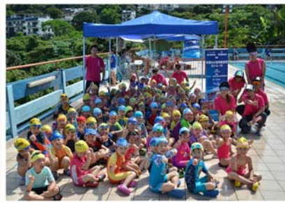
不求與人相比 只求突破自己